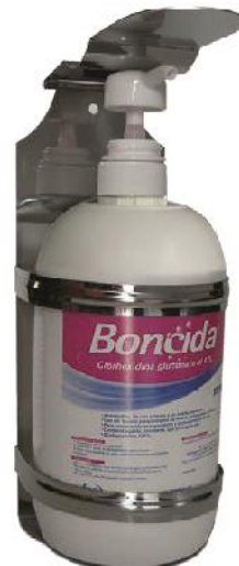
Soporte dispensador para presentación de 1 Litro.