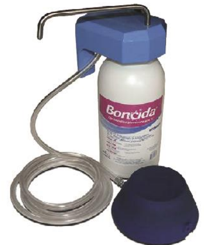
Dispensador manos libres para presentación de 1 Litro.